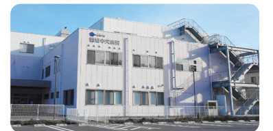
「磐城中央病院」の外来・健診棟。健診サロンは、こちらの建物の2階です。

詳細については「 磐城中央病院 健診サロン (TEL:0570-200-280) 」までお問い合わせください